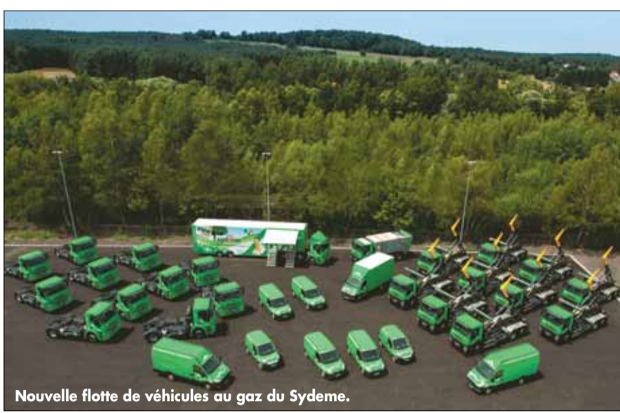
Nouvelle flotte de véhicules au gaz du Sydeme.

Le jeudi 28 juin 2012, la nouvelle plate-forme de réception et de broyage des déchets verts de Morsbach, mise en place à côté du site de Méthavalor, a été investie pour l'occasion par la nouvelle flotte de véhicules au gaz du Sydeme. Progressivement mise en service, la flotte est composée de tracteurs pour les remorques, de porteurs pour les bennes de déchèteries, de bennes de collecte de biodéchets et de véhicules utilitaires pour les ambassadeurs du tri.