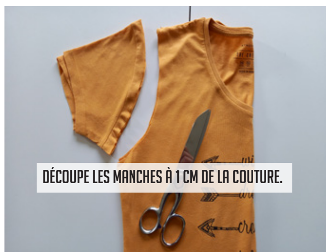
DÉCOUPE LES MANCHES À 1 CM DE LA COUTURE.