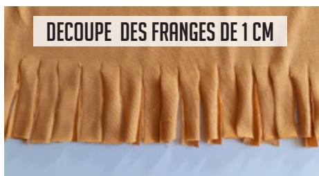
DECOUPE DES FRANGES DE 1 CM