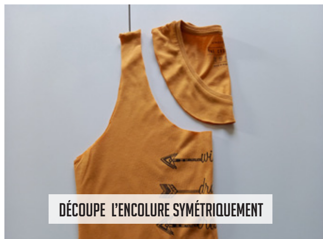
DÉCOUPE L'ENCOLURE SYMÉTRIQUEMENT