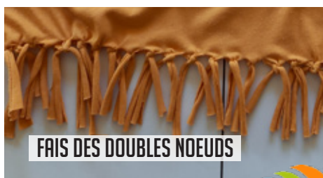
FAIS DES DOUBLES NOEUDS