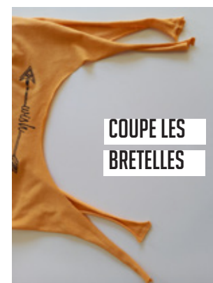
COUPE LES BRETelles