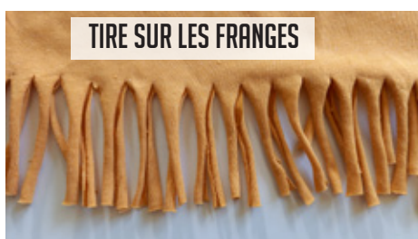
TIRE SUR LES FRANGES