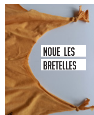
NOUE LES BRETelles