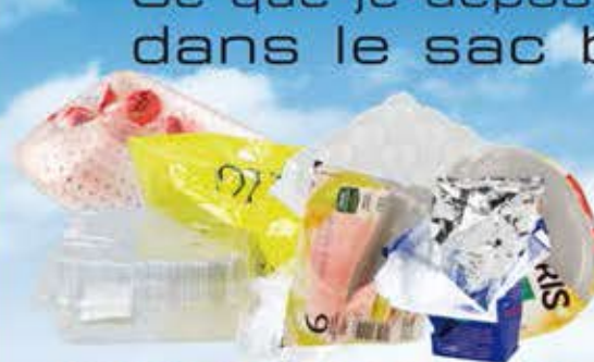
Films et barquettes alimentaires, sacs et sachets en plastique.