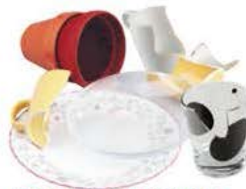
Pots en terre cuite, pyrex, porcelaine, vaisselle cassée.