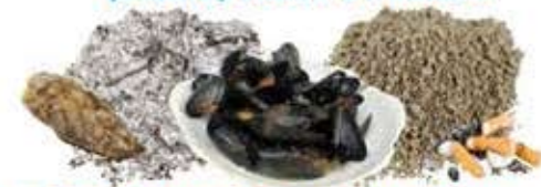
Déchets minéraux, cendres de cheminée, coquilles de crustacés, litière de chats, mégots de cigarettes et cendres.