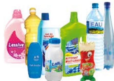
Bouteilles et flacons en plastique avec leurs bouchons