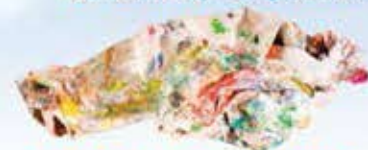
Textiles hors d'usage