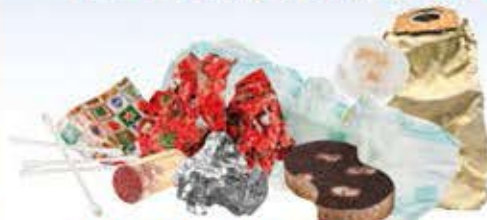
Papier cadeau, éponges, lingettes nettoyantes, couches culottes et contenu de la poubelle de salle de bain, sac d'aspirateur plein, bouchons de liège, feuilles d'aluminium.