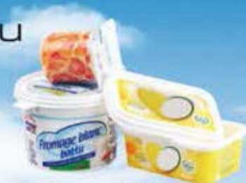
Pots de beurres, de crème, de yaourt.