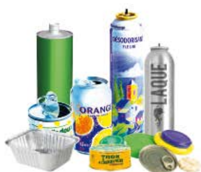
Emballages en acier et en aluminium, couvercles et capsules métalliques