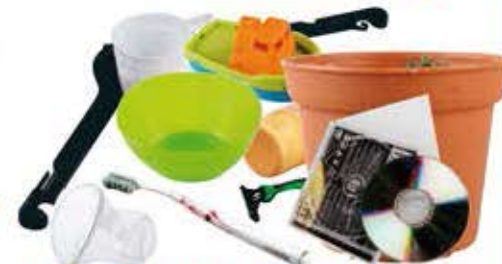
Autres déchets en plastique : jouets, cintres, rasoirs, brosses à dents, vaisselle jetable, tubes et boîtes.