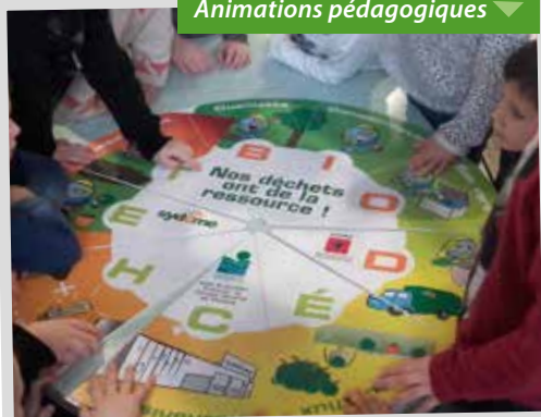
Centre Transfrontalier d'Éducation à l'Environnement ▲