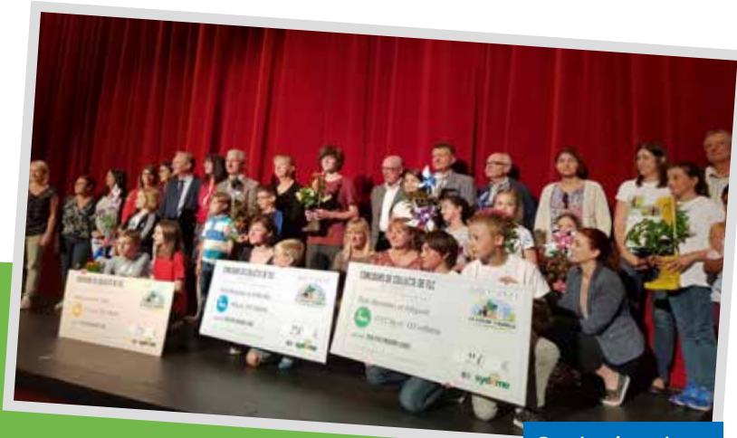
Remise des prix ▲

Toutes les classes ont été conviées et récompensées par un spectacle plein d'humour sur le thème de l'environnement !