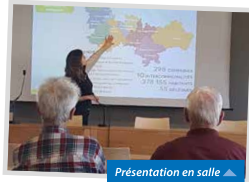
Présentation en salle ▲