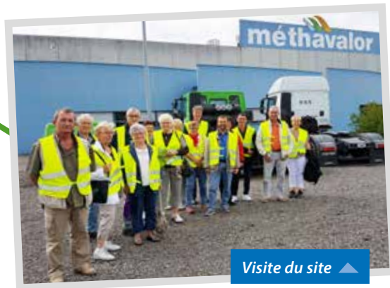
Visite du site ▲