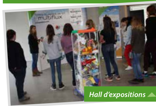
Hall d'expositions ▲