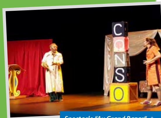
Spectacle "Au Grand Bazar" ▲